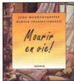
Mourir en vie!