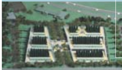
Maquette du mausolée du Bois de l'Est : une conception innovatrice, qui permet une remarquable intégration à l'environnement.

Le Cimetière, un organisme sans but lucratif qui ne reçoit aucune subvention de la part des gouvernements, gère ses opérations de manière à permettre leur équilibre financier pour assurer sa pérennité et s'acquitter de ses obligations à long terme.