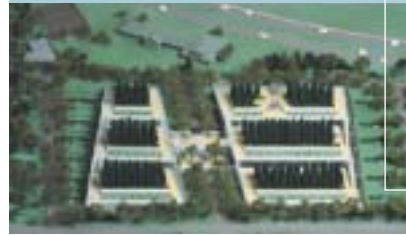
Maquette du mausolée du Bois de l'Est : une conception innovatrice, qui permet une remarquable intégration à l'environnement.

Le Cimetière, un organisme sans but lucratif qui ne reçoit aucune subvention de la part des gouvernements, gère ses opérations de manière à permettre leur équilibre financier pour assurer sa pérennité et s'acquitter de ses obligations à long terme.